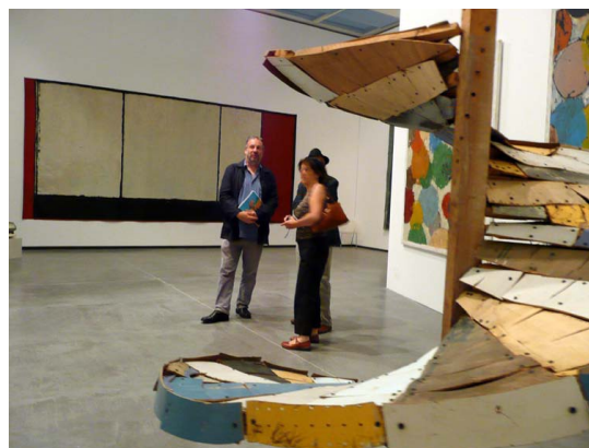
Exposition Pincemin, musée des Beaux-Arts, Angers 2010

La conférence propose une lecture du parcours pictural et sculptural d'un artiste complexe qui aura toujours su passer outre toutes les conventions techniques et esthétiques admises. Fondée sur de nombreux témoignages et une documentation importante, cette intervention montrera, au-delà du passage de l'abstraction vers des éléments narratifs dans sa peinture, comment il est possible de mettre en relation les différentes époques et styles de l'artiste, de pointer des thèmes récurrents, de révéler les sources iconographiques originales et bien d'autres aspects surprenants dans l'œuvre foisonnante de Jean-Pierre Pincemin.