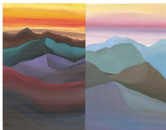
1 - En Attendant les bateaux , 2017. Gouache sur papier, 25 x 41 cm.