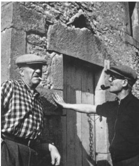
Fernand Léger et Le Corbusier à La Goulotte, c. 1937

En 2013, ce lieu a reçu du Ministère de la Culture et de la Communication le label « Maison des Illustres ».