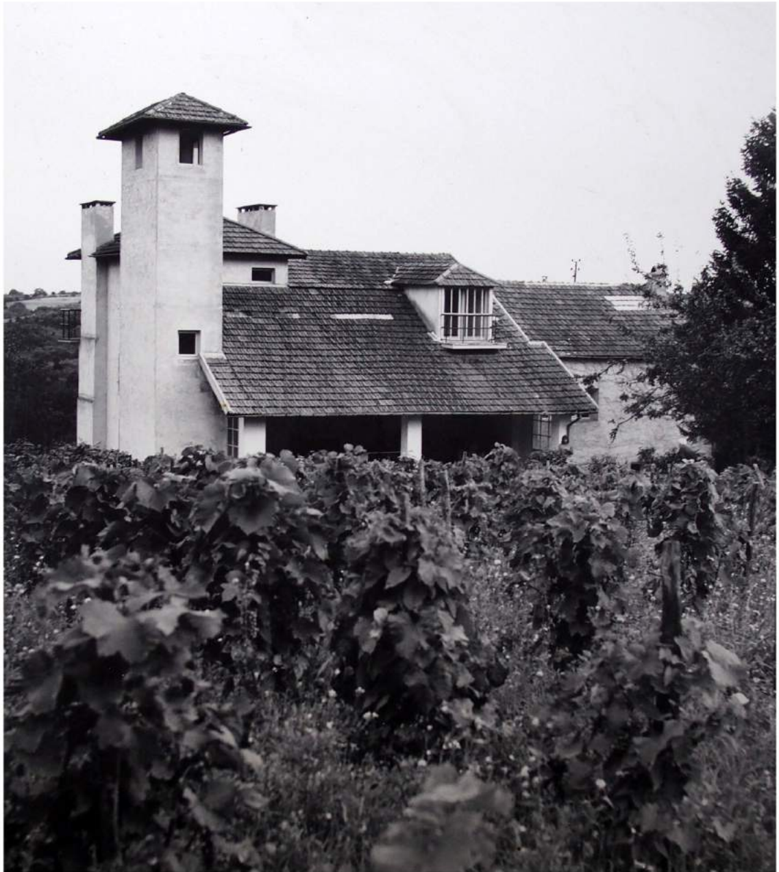
ASSOCIATION « FONDATION CHRISTIAN & YVONNE ZERVOS » MAISON DE LA GOULOTTE VEZELAY

Maison des Zervos à La Goulotte, hameau de Vézelay, photographie des années 1960.