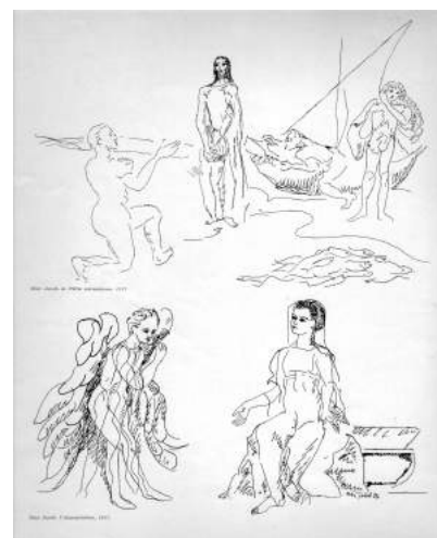
Dessins de Max Jacob parus dans le n°2 de Cahiers d'Art , en 1928